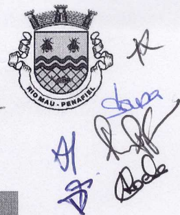
Tabela de Taxas – 2023